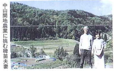
中山間地農業に挑む稗苗夫妻