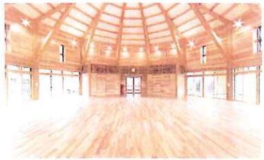
学生生活のリフレッシュに期待

県立大の 学生会館竣工 射水市黒河にある富山 県立大の学生会館竣工式 が、平成31年4月20にあ り、稗苗県議も出席して 喜び合いました。 100人収容のホール や談話コーナー、学生会 室、留学生支援室など完