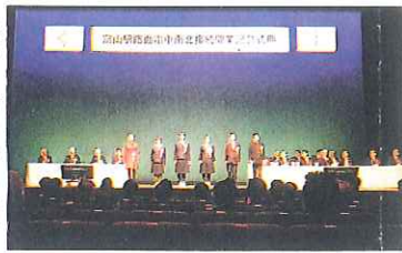
つながる ひろがる百年の夢実現

富山路面電車は3月21日、南北が接続を果し、百年以上続いた鉄路による市街地分断が解消されたとあって、富山市は祝賀ムード一色に包まれました。