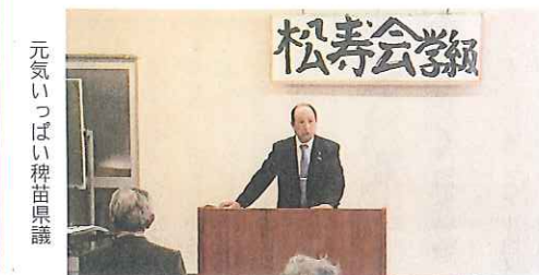
元気いっぱい稗苗県議