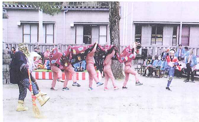
「子ども獅子舞」には 小中学生も参加しました

魚津市金山谷の春祭りは3月15日、金山谷神明社であり、「金山谷獅子舞保存会」が長らく伝えられてきた獅子舞を奉納しました。