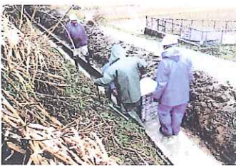
用水の整備を急ぐ農家の皆さん(魚津市内)

の安全には、モデル地区33カ所です。転落防止対策を推進するとしているが、春田はすぐそこ。待ったなしだ。