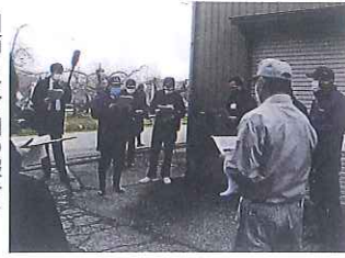
川西リンゴ園の報告を受ける新田知事