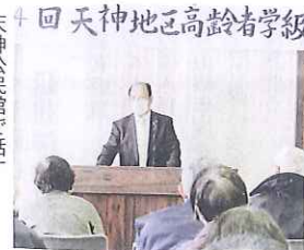
天神公民館で話す

コロナ禍の中で稗苗県議の県政報告会は、下中島(1月21日、24名)、天神(同23日、29名)、東山(同30日、24名、