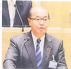
答弁する新田知事

石黒厚生部長 市町村から情報不足で接種場所の確保や医師・看護師の確保が難しいなど課題があるとお聞きし、全国知事会の緊急対策本部の提言に盛り込んでもらった。感染再拡大に備え、検査、医療提供体制を整備する。県民への適時適切な注意喚起にも努めて